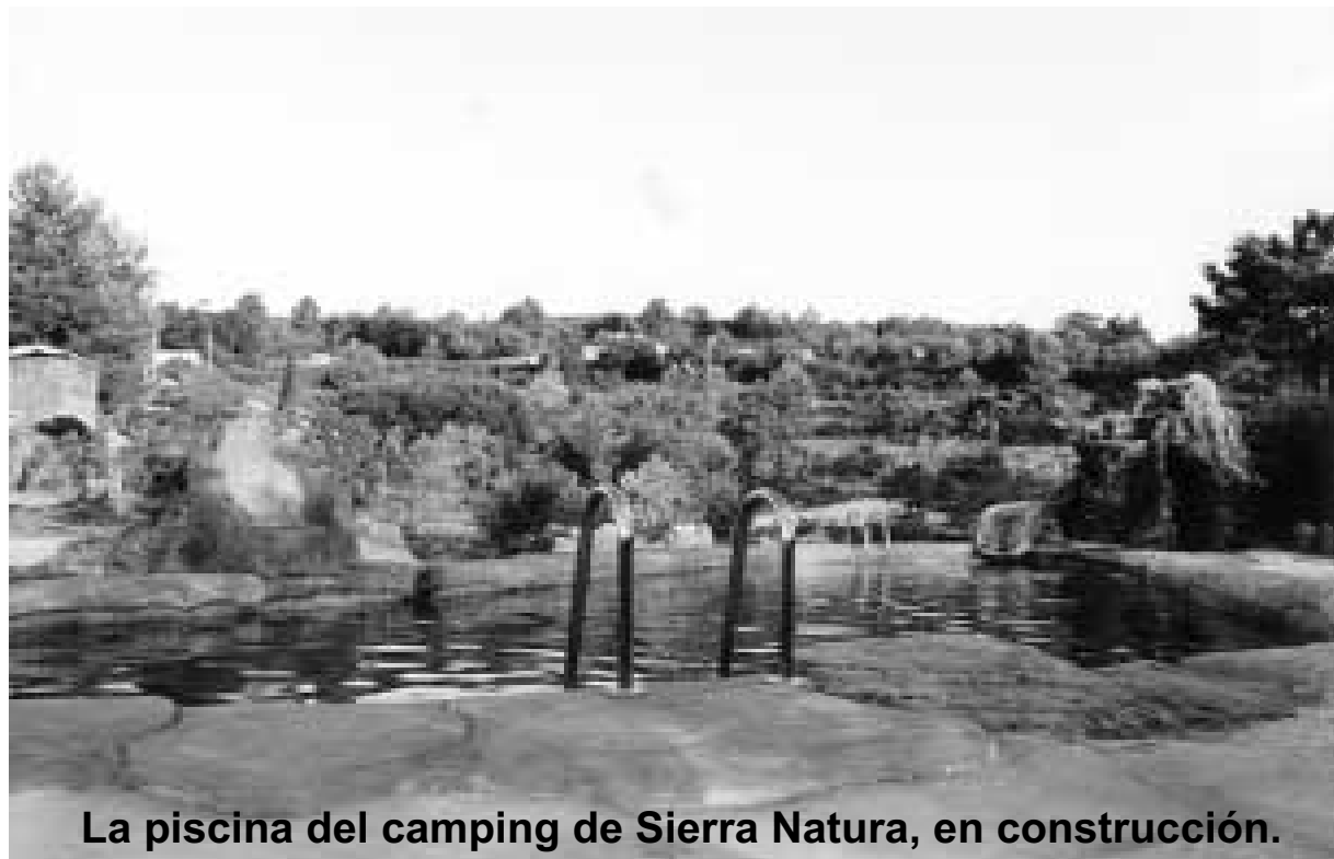
La piscina del camping de Sierra Natura, en construcción.

En la Sierra de Enguera, dentro de la provincia de Valencia se está terminando la construcción del camping Naturista SIERRA NATURA.